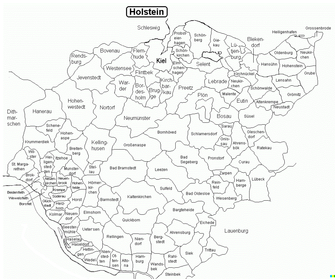
Kort over sognene i Holsten på www.slaegtogdata.dk . Oprindeligt udarbejdet af Svend-Erik Christiansen.

Ligeledes er der mulighed for løbende at få bladet Computergenealogie tilsendt til gennemsyn via læsekredsen Tyskland: http://slaegtogdata.dk/andet/laesekredse .